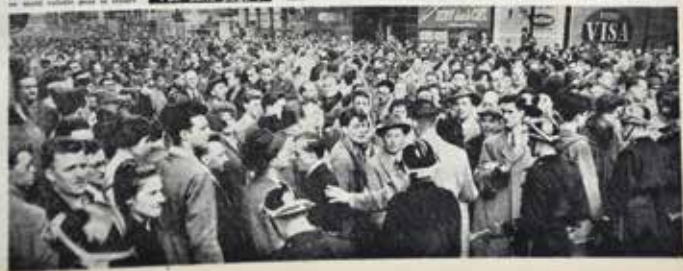
Guerre et paix scolaires

Les dictateurs ridicules ont été ridiculisés par les manifestants de la liberté.