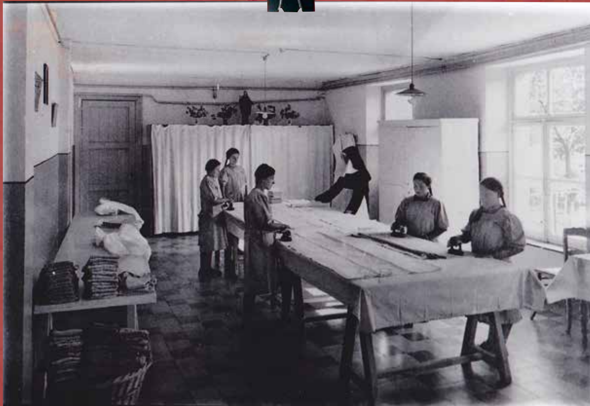
Démocratisation et massification de l'enseignement secondaire