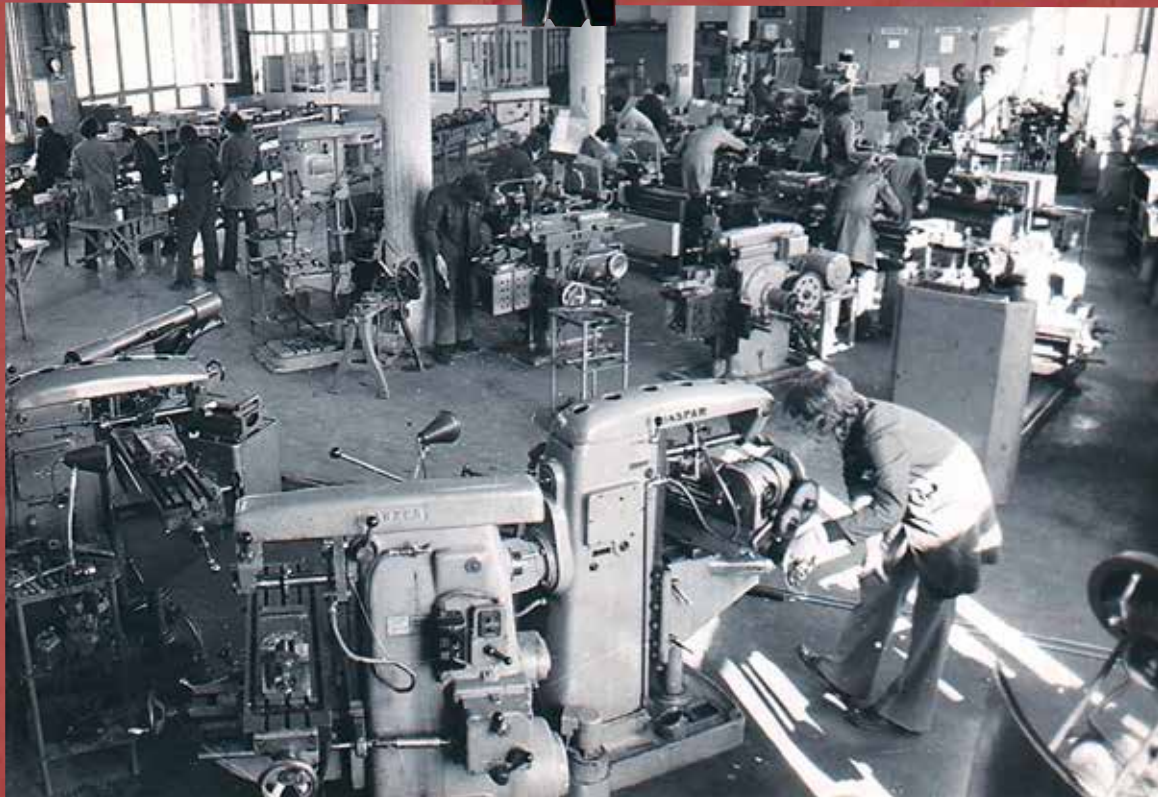
Démocratisation et massification de l'enseignement secondaire