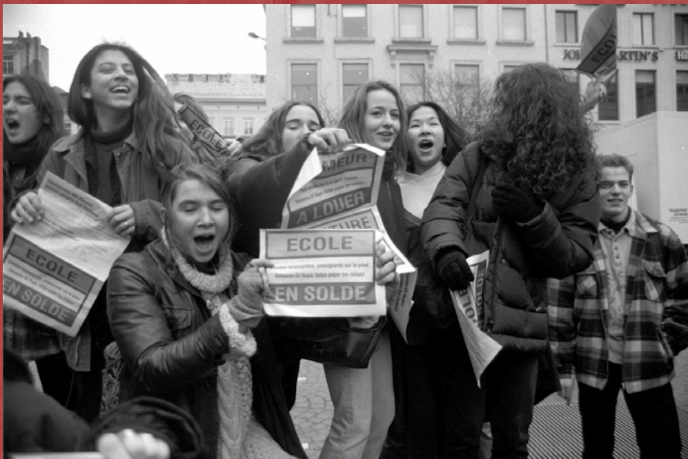
Le secondaire en grève pendant cinq mois