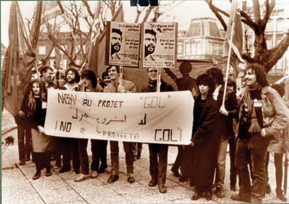
La loi « Gol », une politique d'intégration ambiguë