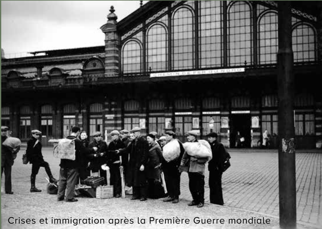
Crises et immigration après la Première Guerre mondiale