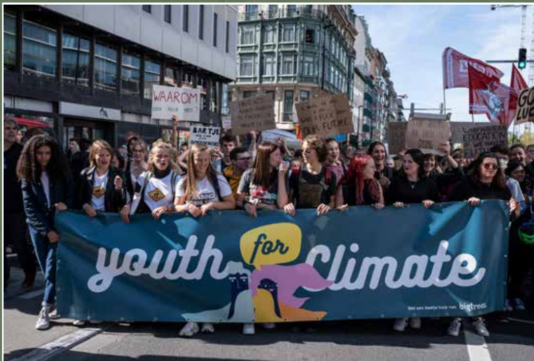
Marches des jeunes : « Plus chauds que le climat ! »