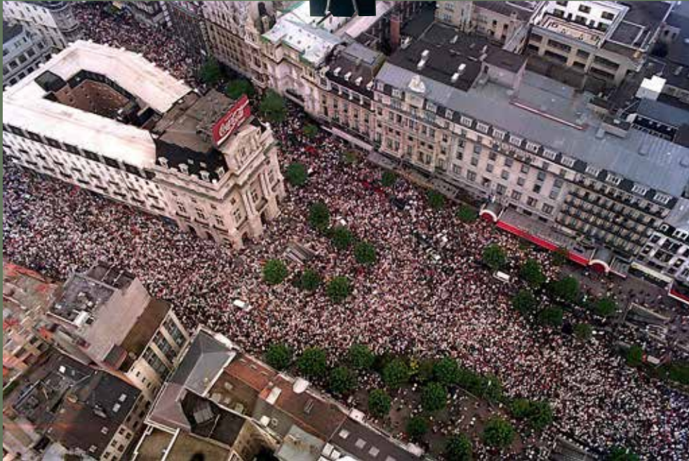
La Marche blanche « au nom de tous les enfants disparus »