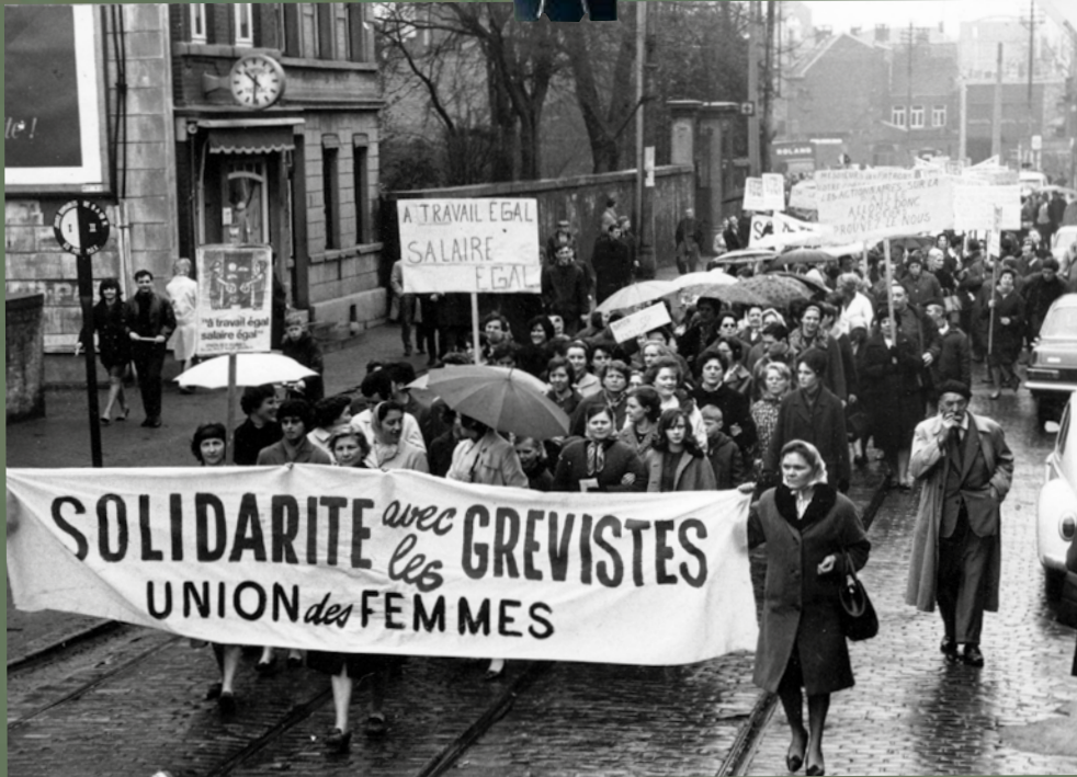
La grève des femmes de la FN