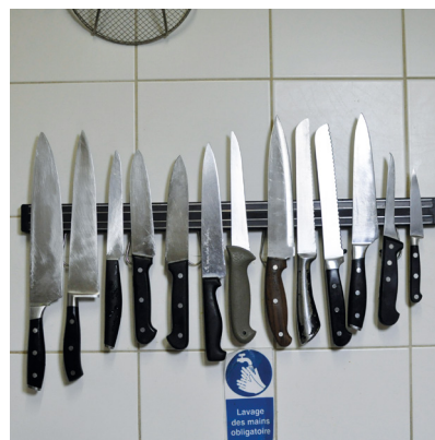
Des couteaux de cuisine