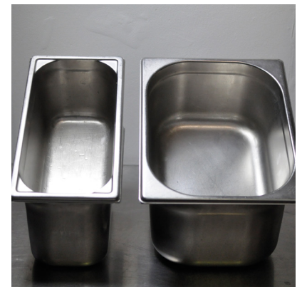
Des bacs de rangement alimentaire « gastro »