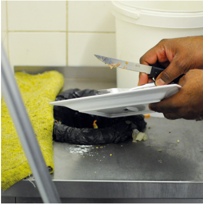
Jeter les déchets