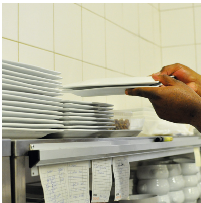
Ranger la vaisselle