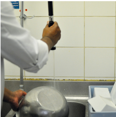
Rincer la vaisselle