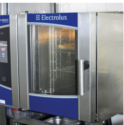
Un four professionnel