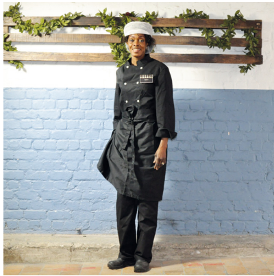
Un équipement adapté