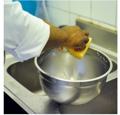
Laver avec une éponge