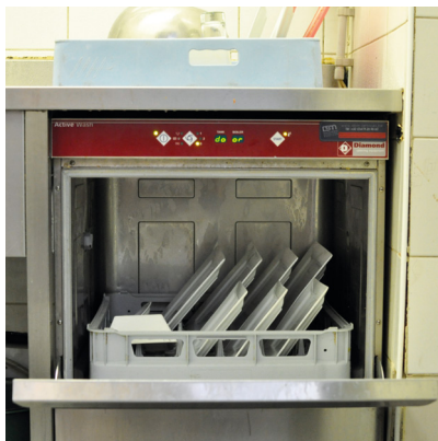
Un lave-vaisselle professionnel