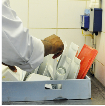
Trier la vaisselle