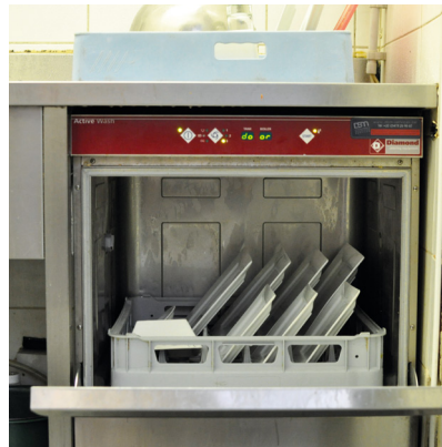
Remplir le lave-vaisselle de façon optimale