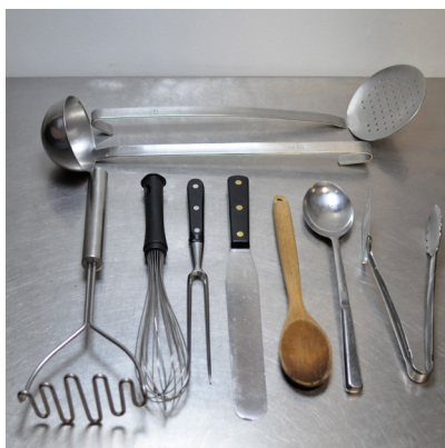
Des petits ustensiles de cuisine