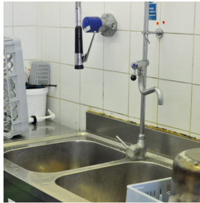
Le poste de travail