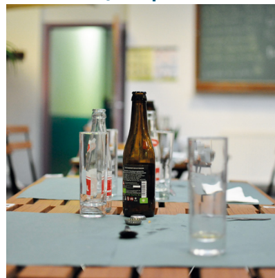
Aider en salle en fin de service