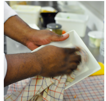
Essuyer la vaisselle