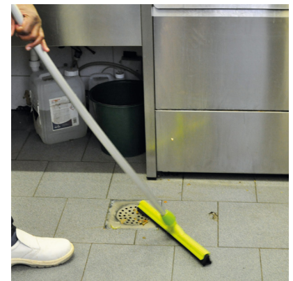
Nettoyer la cuisine