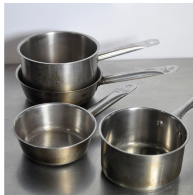
Une batterie de cuisine